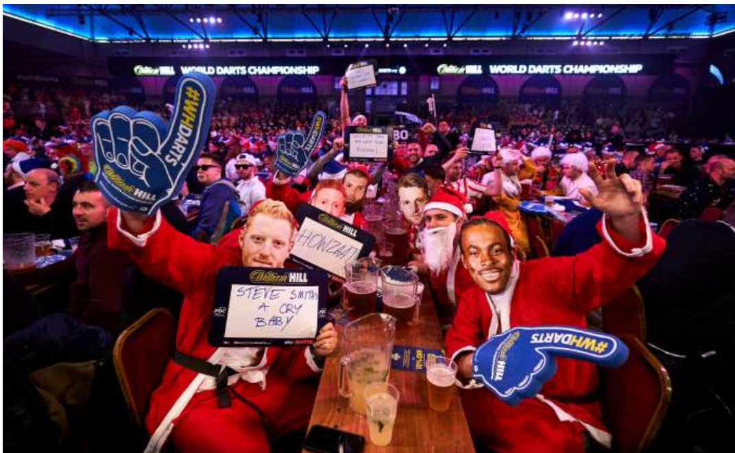
Die Fans an der Darts-WM gelten als besonders verrückt.